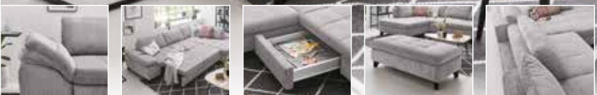
Armteilverstellung Schlaffunktion Schubkasten Hocker Sitztiefenverstellung