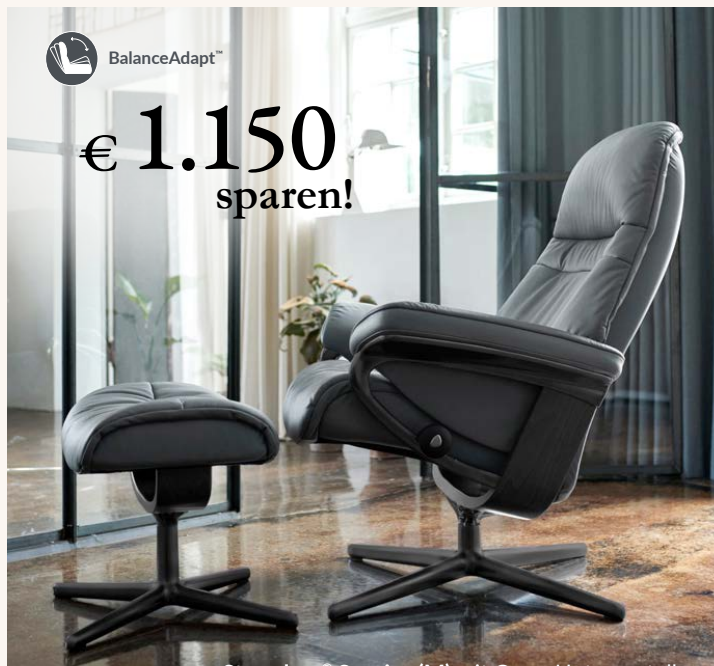
Stressless® Sunrise (M) mit Cross Untergestell