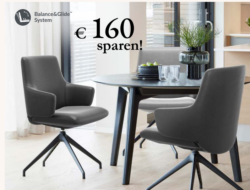
Stressless® Laurel (L) D350 niedrig mit Armlehnen