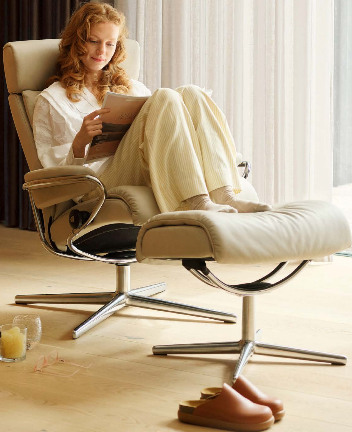
Stressless® Tokyo mit verstellbarer Kopfstütze und Cross Untergestell inkl. Hocker in Leder ab € 3.309*

AUF STAHLRAHMEN UND DIE INNEREN FUNKTIONEN 1