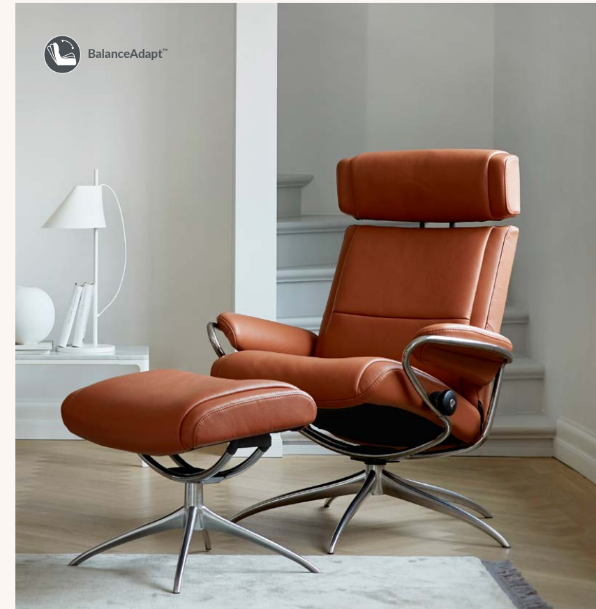
Stressless® Paris mit verstellbarer Kopfstütze und Star Untergestell inkl. Hocker in Leder ab € 3.309*

Stressless® Möbels entscheiden Sie sich für hohe Qualität, die Sie ein Leben lang begleiten wird.