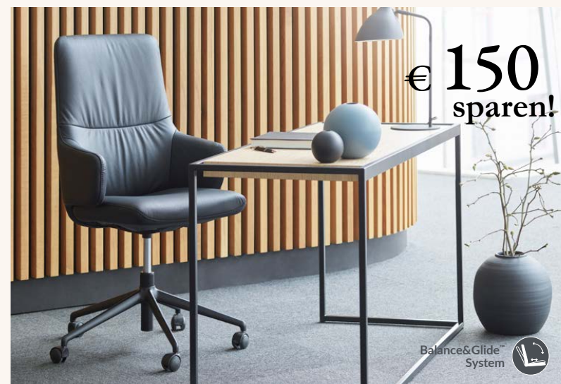
Stressless® Mint (L) Home Office Stuhl hoch mit Armlehnen