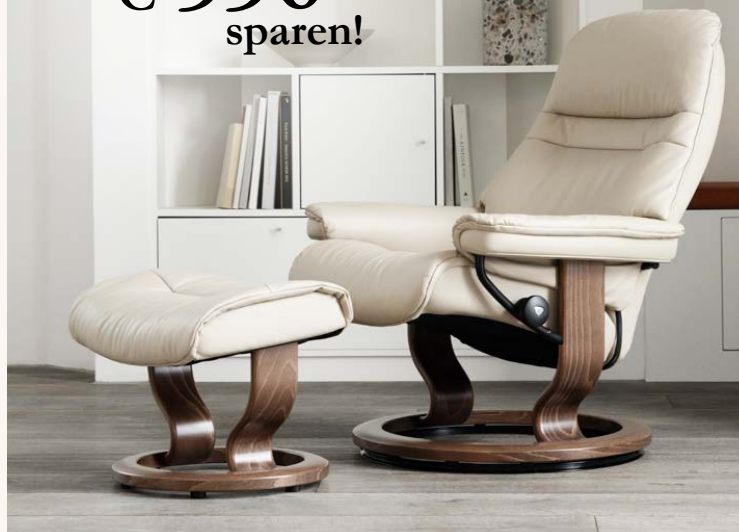
Stressless® Sunrise (M) mit Classic Untergestell inkl. Hocker in Leder „Batick“ nur € 2.149* statt € 2.699**