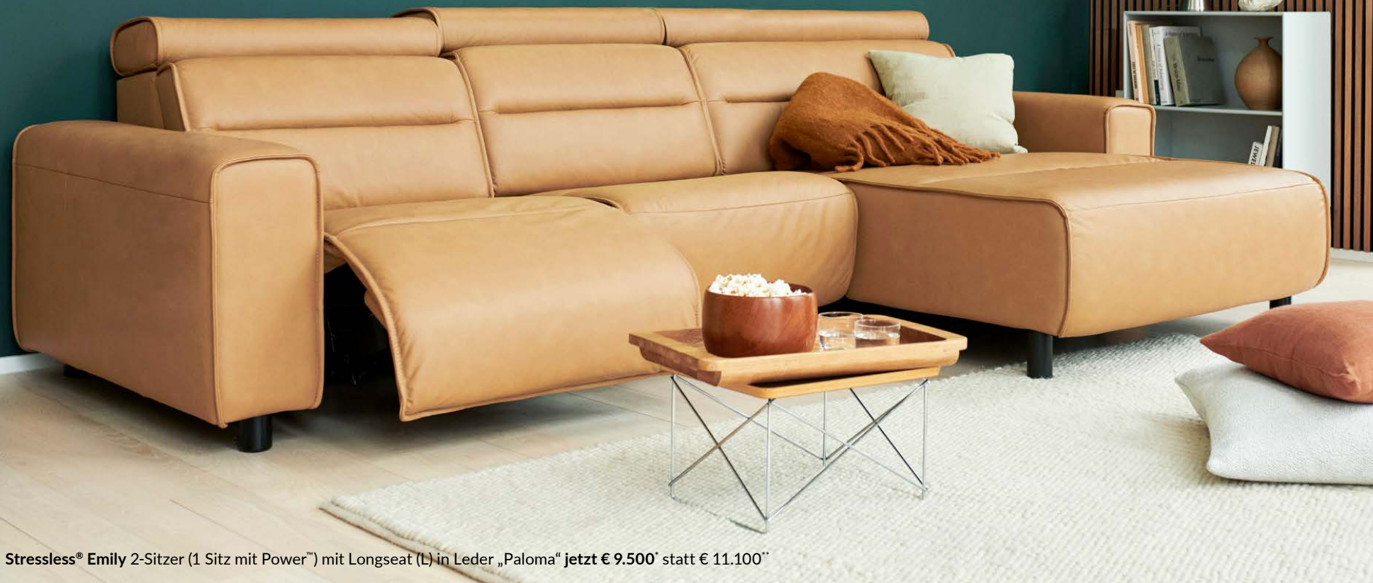
Stressless® Emily 2-Sitzer (1 Sitz mit Power™) mit Longseat (L) in Leder „Paloma“ jetzt € 9.500* statt € 11.100**