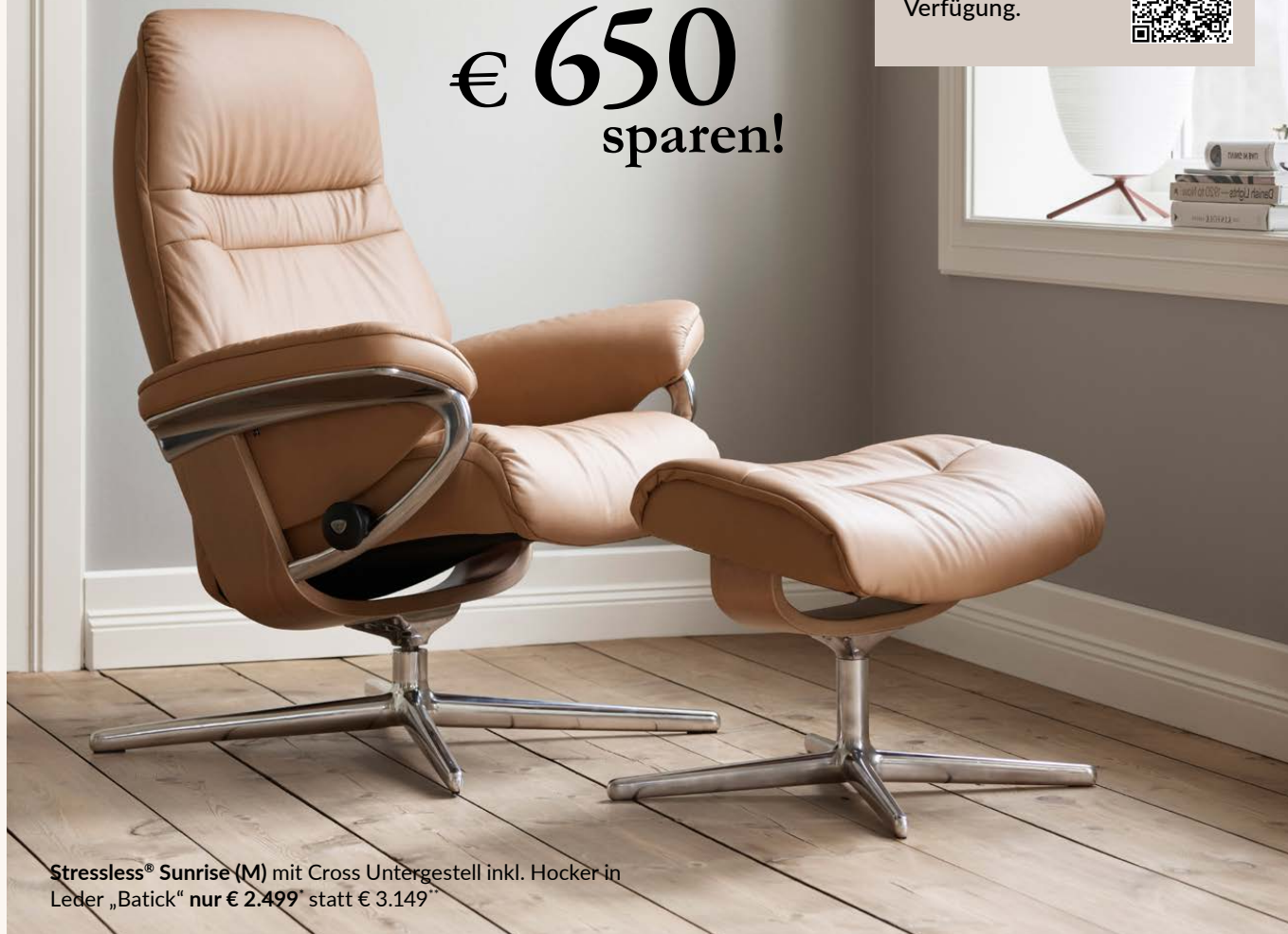
Stressless® Sunrise (M) mit Cross Untergestell inkl. Hocker in Leder „Batick“ nur € 2.499* statt € 3.149**