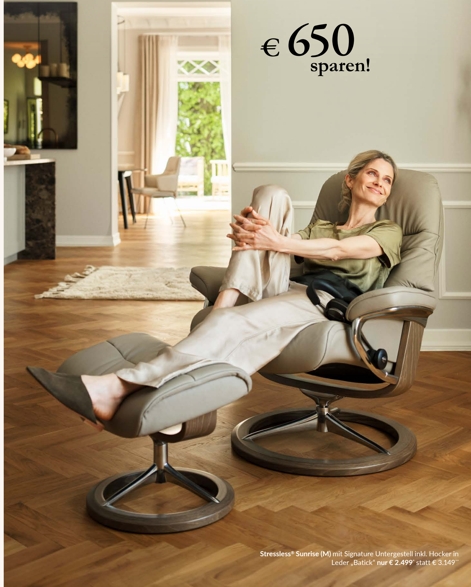
Stressless® Sunrise (M) mit Signature Untergestell inkl. Hocker in Leder „Batick“ nur € 2.499* statt € 3.149**