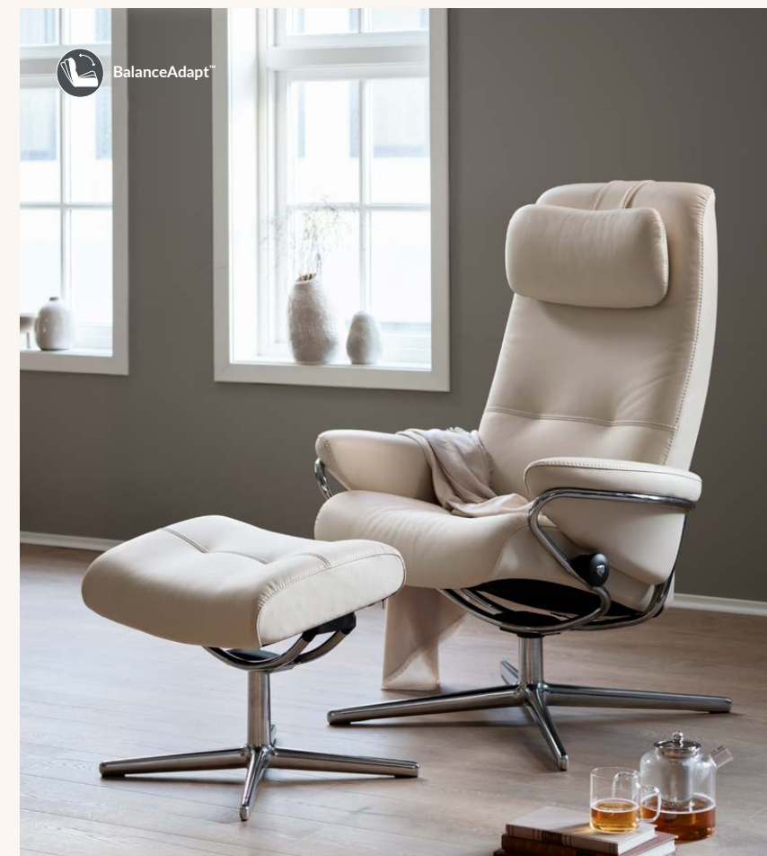
Stressless® Berlin High Back mit Cross Untergestell inkl. Hocker in Leder ab € 3.309*