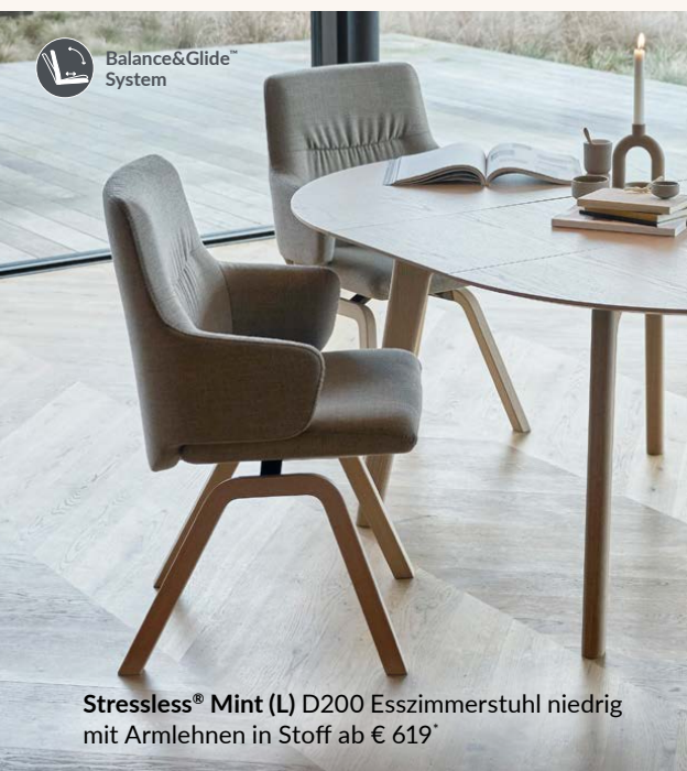
Stressless® Mint (L) D200 Esszimmerstuhl niedrig mit Armlehnen in Stoff ab € 619*