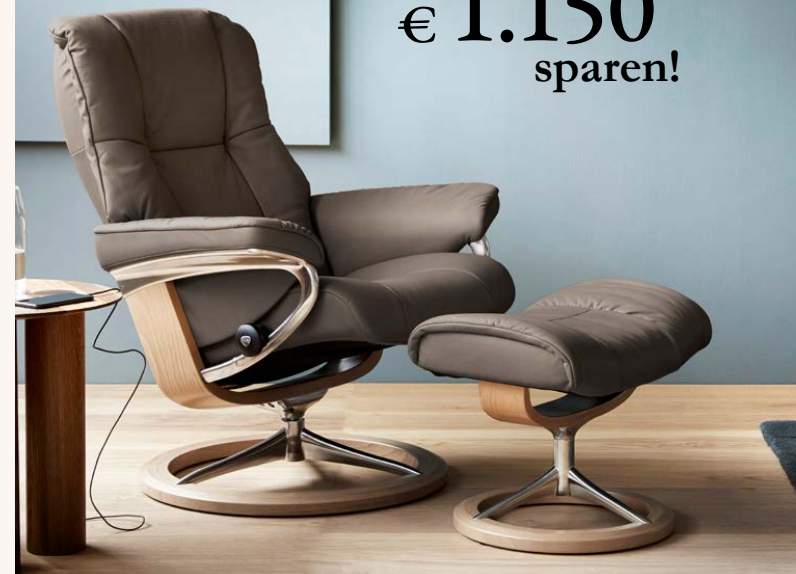
Stressless® Mayfair (M) mit Signature Untergestell